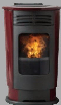
Cerámica burdeos Cerâmica bordeaux Κεραμικό μπορντό Bordeaux ceramic