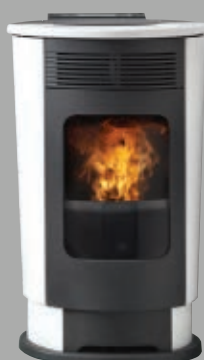
Cerámica blanca crema Cerâmica branca nata Κεραμικό λευκό κρέμα Cream white ceramic