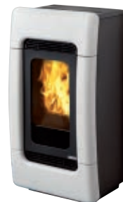
Cerámica blanca crema Cerâmica branca nata Κεραμικό λευκό κρέμα Cream ceramic