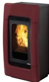
Cerámica burdeos Cerâmica bordeaux Κεραμικό μπορντό Bordeaux ceramic