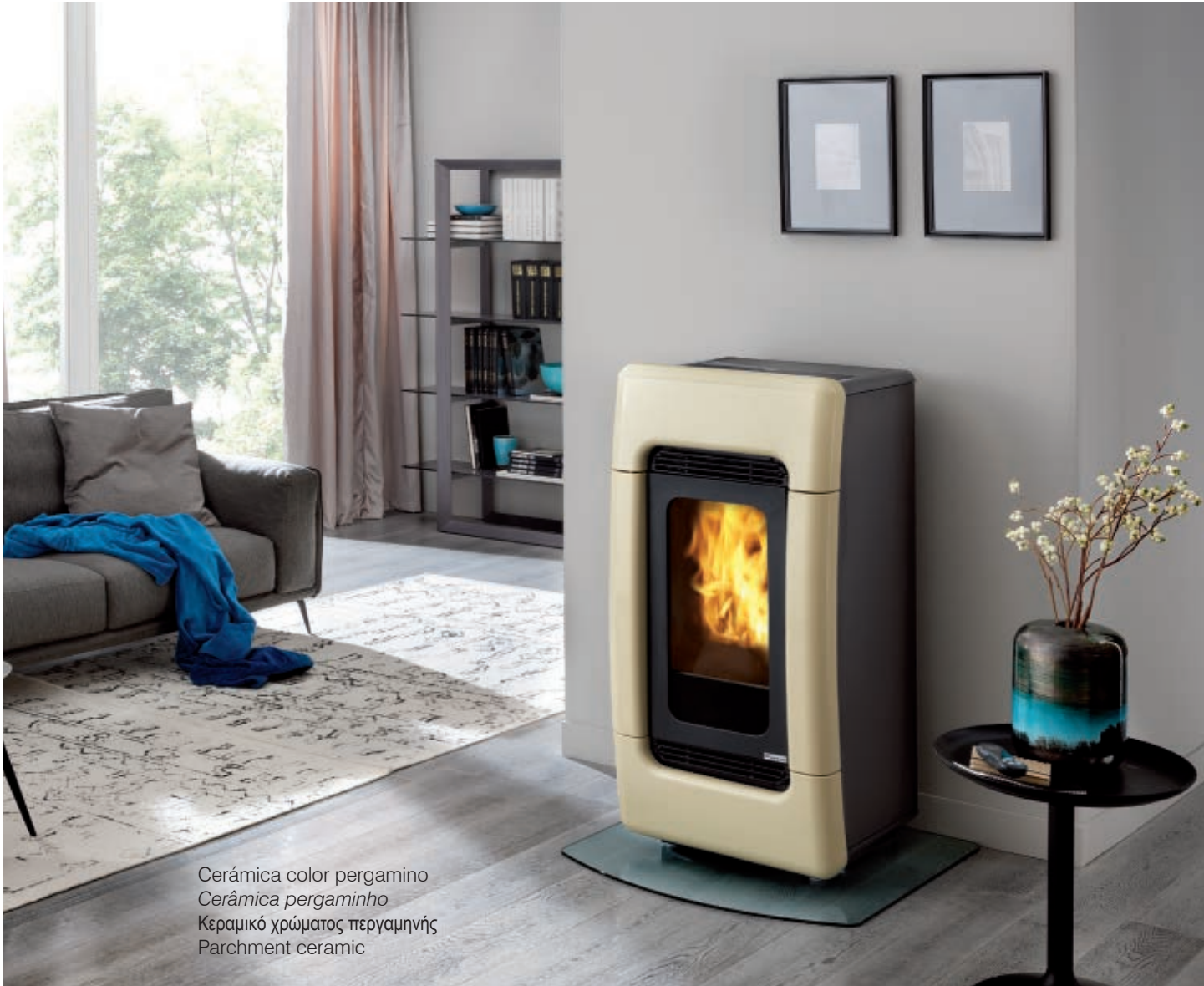
Cerámica color pergamino Cerâmica pergaminho Κεραμικό χρώματος περγαμηνής Parchment ceramic