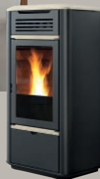
Cerámica color pergamino cerâmica pergaminho Κεραμικό χρώματος περγαμινής parchment ceramic