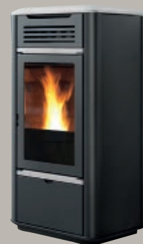
Cerámica blanca crema Cerâmica branca nata Κεραμικό λευκό κρέμα Cream ceramic