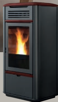
Cerámica burdeos Cerâmica bordeaux Κεραμικό μπορντό Bordeaux ceramic