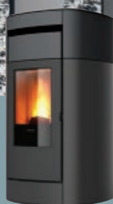
Cerámica gris oscuro Cerâmica cinza escuro Κεραμικό γκρι σκούρο Ceramic dark grey