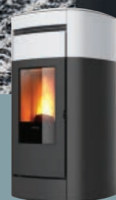
Cerámica blanco mate Cerâmica branca opaca Κεραμικό λευκό ματ Opaque white ceramic

Posibilidad de desviar el aire caliente canalizado(B) Possibilidade de desviar o ar quente canalizado (B) Δυνατότητα εκτροπής της παροχής θερμού αέρα (B) Choice to divert ducted hot air (B)